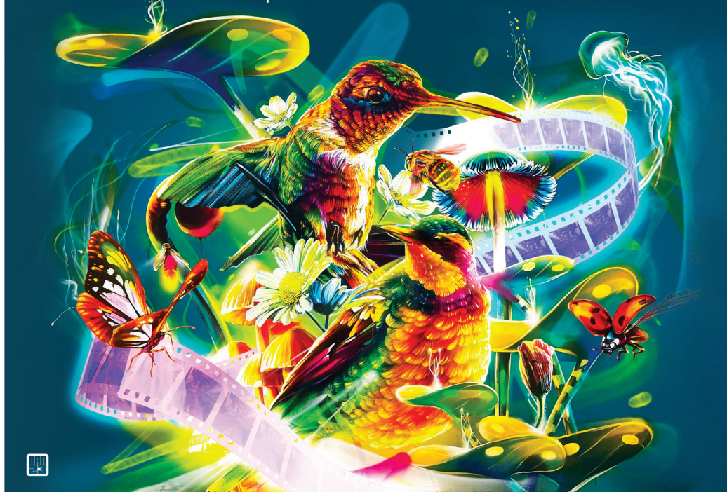
Illustration : Dan23.com / graphisme : vesimages.ch